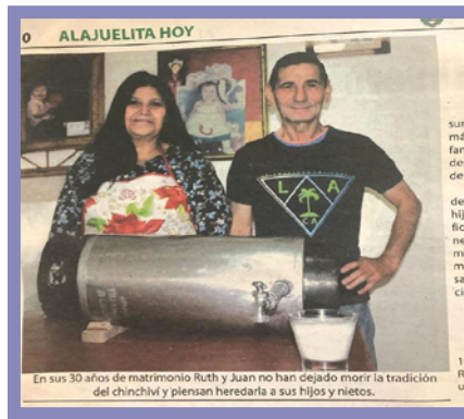
Periódico Alajuelita Hoy

postre y que hasta menores de edad pueden tomarlo por su grado de fermentación que es menor al de la chicha, probablemente en la canción Alajuelita tú eres mi cantón, se malinterpreta que el chinchiví pone a la gente ebria, pero que realmente es la chicha”.