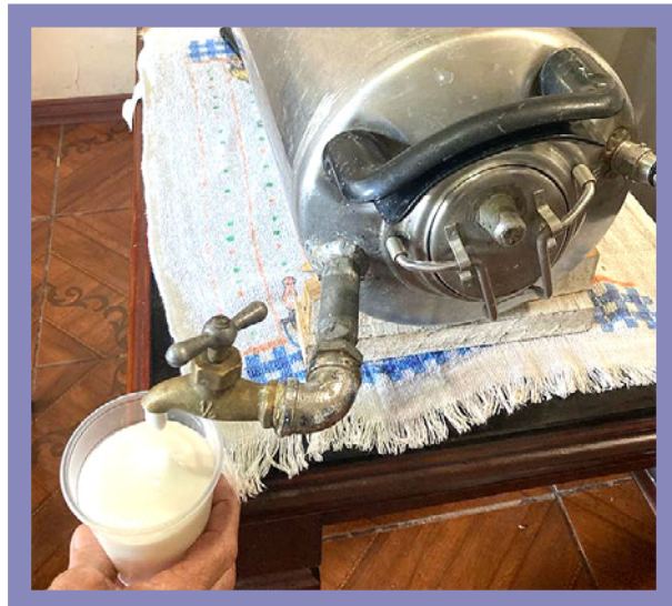
Periódico Alajuelita Hoy