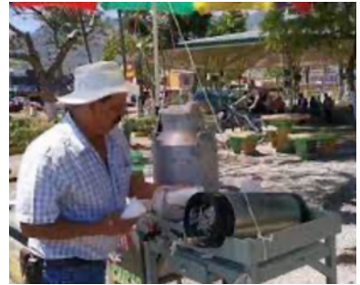
Ilustración 7 Charías con sus lecheras y barriles