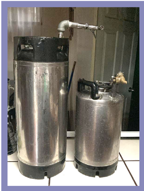
Periódico Alajuelita Hoy

Y este es el nombre que conserva la bebida hasta nuestros días.