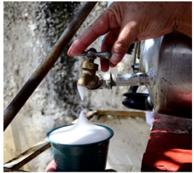
Ilustración 5 chinchiví de Cuti