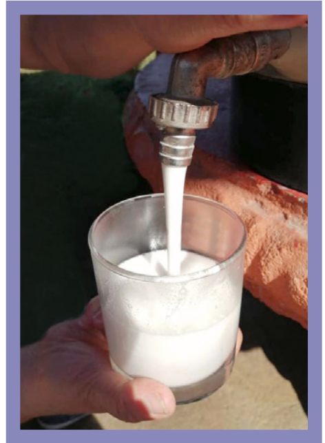
Periódico Alajuelita Hoy

una bebida con un sabor agradable, refrescante, además que su textura espumosa hace que la bebida se